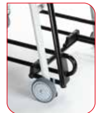
Um das Hinsetzen und Aufstehen zu erleichtern, sind die Arm- und Fußstützen hochklappbar.