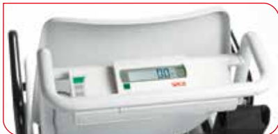
Das Display ist praktisch positioniert und lässt sich leicht bedienen.

Die seca 959 verfügt über vier leichtgängige und wendige Räder, die den Einsatz selbst auf engstem Raum ermöglichen.